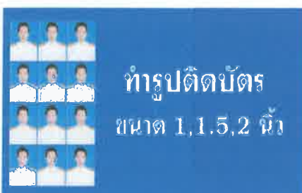
ตัวอย่างรูปถ่าย ขนาด ๑ นิ้ว