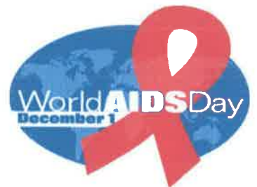
สัญลักษณ์วันเอดส์โลก