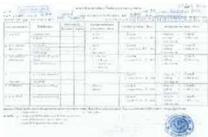
ตัวอย่างเอกสารรับรองสภาพความพิการที่ รับรองโดยแพทย์เฉพาะทาง