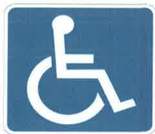
สัญลักษณ์คนพิการ